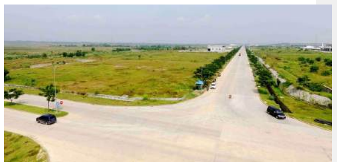
Proyek Jalan & Saluran Kawasan Deltamas