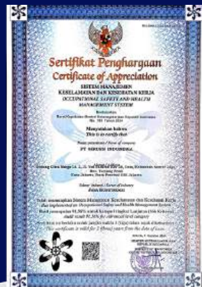
SERTIFIKAT SMK3 KEMENAKER