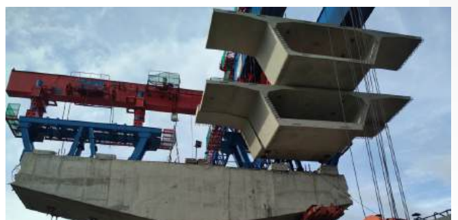
Proyek Jalan Tol Bogor Ring Road Seksi IIIA