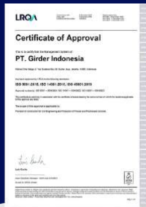
LRQA ISO 90011400145001