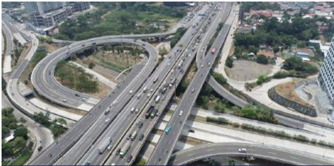
Proyek Tol Depok – Antasari Paket 1 Utara