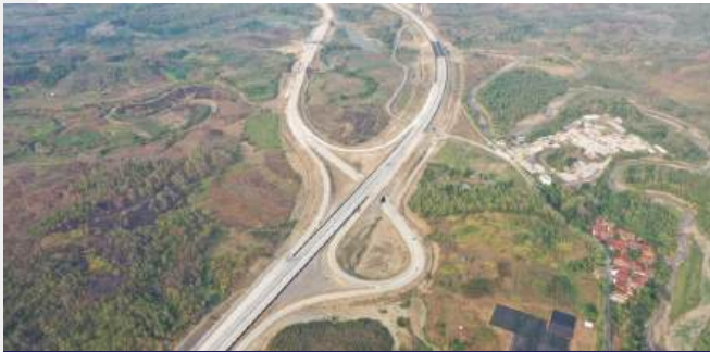
Proyek Jalan Tol Cisumdawu Seksi 6A