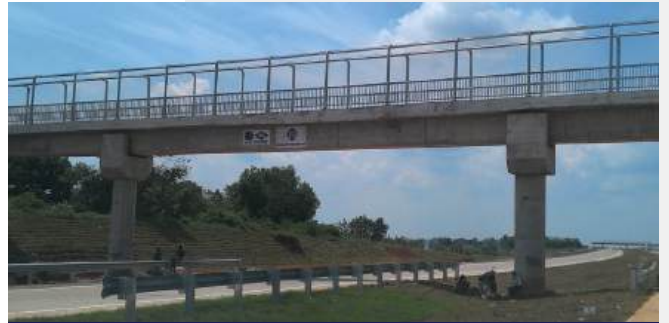
Proyek Jembatan Tol Cipali