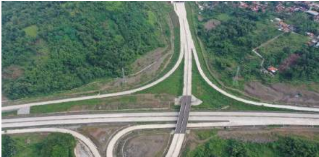
Proyek Jalan Tol Cisumdawu Seksi 3