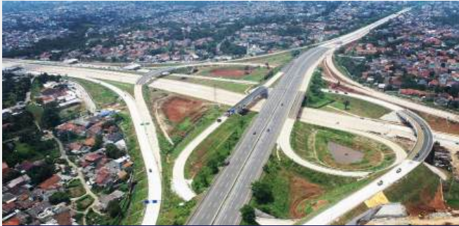
Proyek Tol Depok – Antasari Paket 1 Selatan