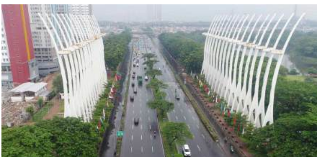
Proyek Pelebaran Ruas Tol Kemayoran