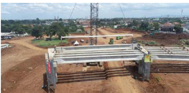
Proyek Pengadaan dan Pemasangan Girder Jalan Tol Depok – Antasari Paket 1 Ruas Brigif