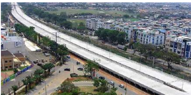
Proyek Tol JORR W1 Paket 6 dan 7