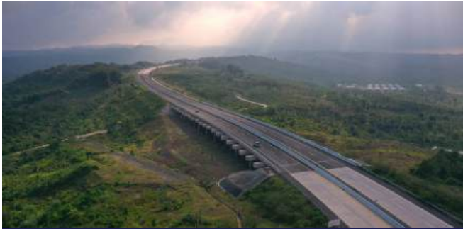
Proyek Jalan Tol Cisumdawu Seksi 5b