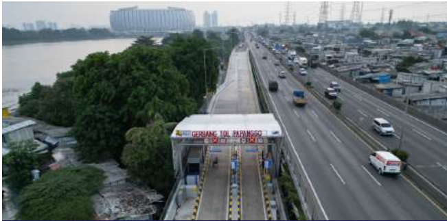
Pekerjaan Pembangunan ON OFF Ramp (Ramp 3 & Ramp 4) Papanggo Utara