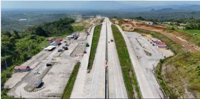
Pembangunan Rest Area Jalan Tol Cisumdawu