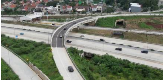
Proyek Jembatan Krukut (Ramp 8) Seksi 1 Selatan