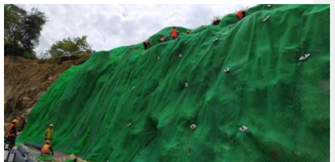
Proyek Stabilisasi Lereng Rampa – Poriaha Mungkur (WINRIP)