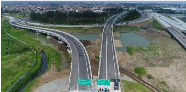
Proyek Jalan Tol Soreang – Pasir Koja